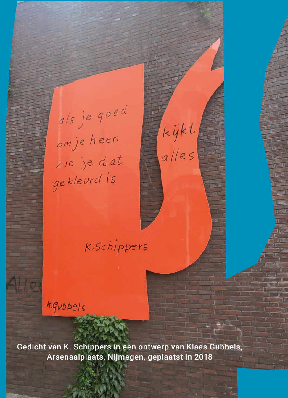
Gedicht van K. Schippers in een ontwerp van Klaas Gubbels, Arsenalplaats, Nijmegen, geplaatst in 2018